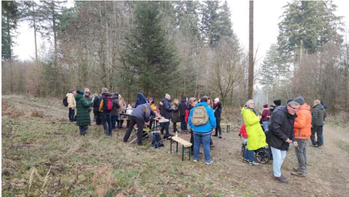
Grünkohlwanderung des Bezirkes Hildesheim am 24.01.2026