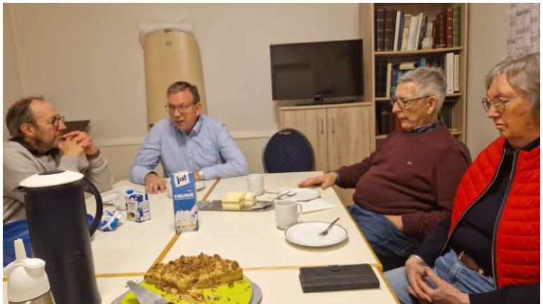
Gemeindecafé am 05.02.2026